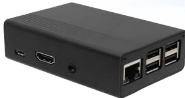
雷達 Siraya Radar