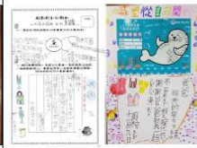
(五)淨校服務、減塑教育融入課程