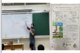
(二)減塑教育融入國語課第七課-從自己開始