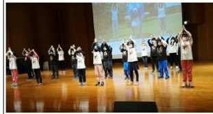
(一)參與減塑講座-全班上台表演 BB 舞