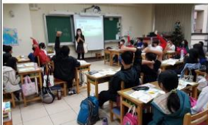
教師總結綠色生活並以自己的綠色包包現身說法