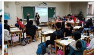
教師總結綠色生活並以自己的綠色包身說說法