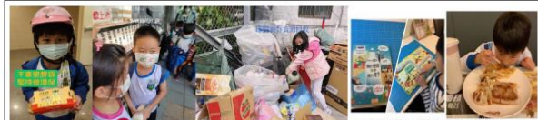
(三)學生於生活中進行減塑行動並上傳在班級群組相互觀摩學習