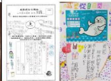
(五)淨校服務、減塑教育融入課程