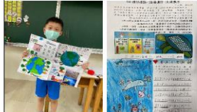
(五)減塑海報及學習單