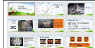
「綠色生活達人」公開授課相關課程簡報