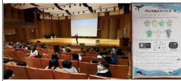
(四)參加「那些海龜教我的塑」減塑講座-完成學習單