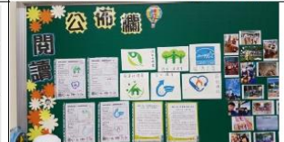
班級拼圖遊戲成果-認識環保節能標章