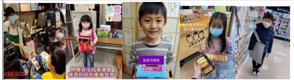
(三)學生於生活中進行減塑行動並上傳在班級群組相互觀摩學習