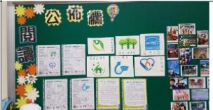
班級拼圖遊戲成果-認識環保節能標章