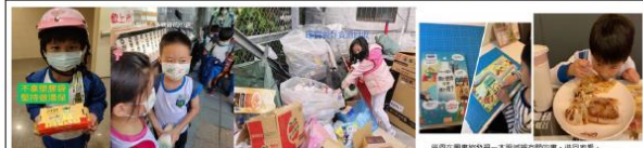
(三)學生於生活中進行減塑行動並上傳在班級群組相互觀摩學習