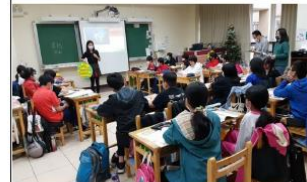
以焦點討論法引導學生記錄與討論影片內容