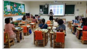
與生命教育社群伙伴進行說課、議課