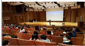
(四)參加「那些海龜教我的塑」減塑講座