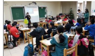
以焦點討論法引導學生記錄與討論影片內容