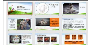
「綠色生活達人」公開授課相關課程簡報