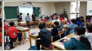
「餅乾擂台」體驗遊戲-過度包裝 VS 拆袋