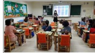
與生命教育社群伙伴進行說課、議課