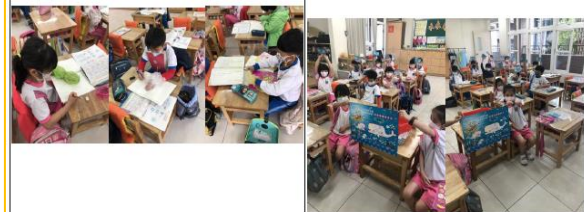
讓學生感受海洋生物受塑膠製品傷害的情境