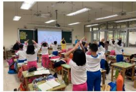
(一)參與減塑講全班表演 BB 舞