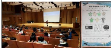
(四)參加「那些海龜教我的塑」減塑講座-完成學習單