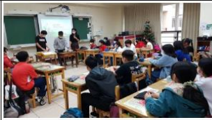
「餅乾擂台」體驗遊戲-過度包裝 VS 裸裝