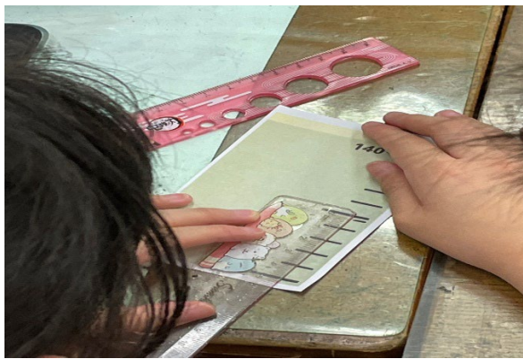
圖一學生測量身高尺上的標記

利用 Jamboard 設計題目，原因是因為 Jamboard 的圖可以拉大縮小，讓學生看清圖片中的刻度，學生的反應都很好，但這次是 1 人寫 1 張白板，教學後我覺得 2 人 1 組 1 人寫白板另 1 個人報告可以解決我 Jamboard 要分男女生白板的困擾，更容易達到組內共學、組間互學。