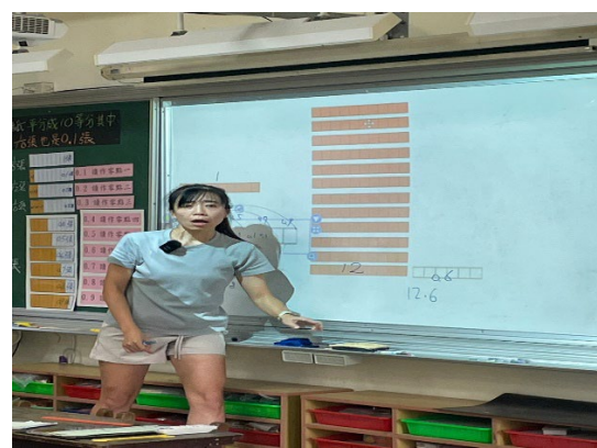
圖六教師利用 HITEACH 作帶小數合作