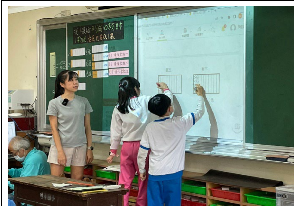
圖三學生進行學習吧的作業發表說明