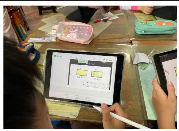
圖四學生進行學習吧的作業