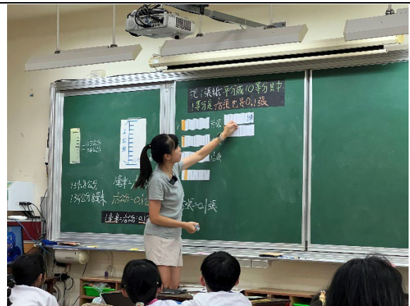
圖二教師進行 0.1 公分的說讀聽寫作