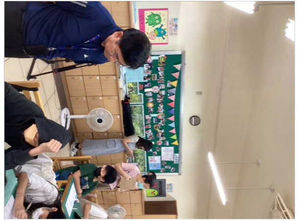
4-1 班級環境的觀察焦點