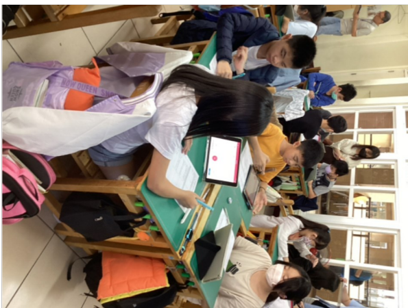
3-2學生在課堂中的參與程度