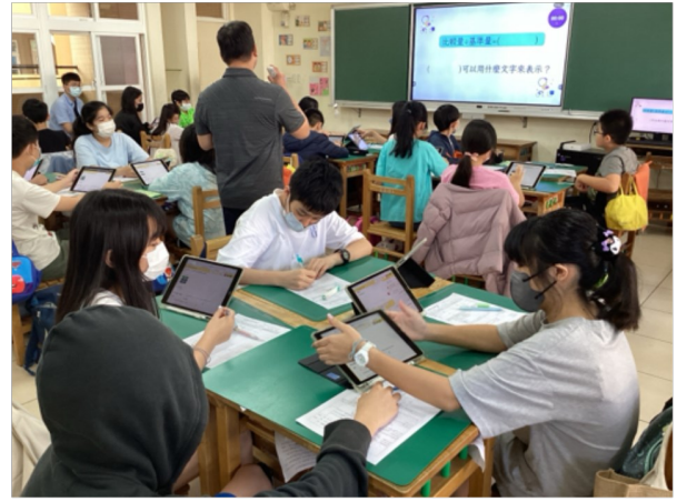
1-1 清楚呈現課程教學的目標或主題？