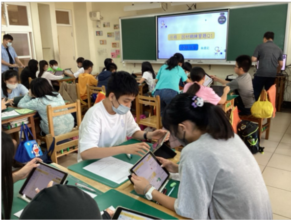
1-1 清楚呈現課程教學的目標或主題？