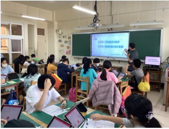
1-1 清楚呈現課程教學的目標或主題？