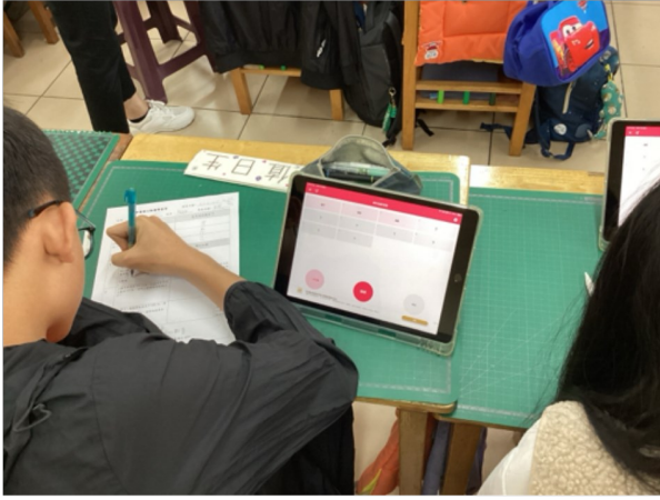
2-2教學目標涵蓋層面