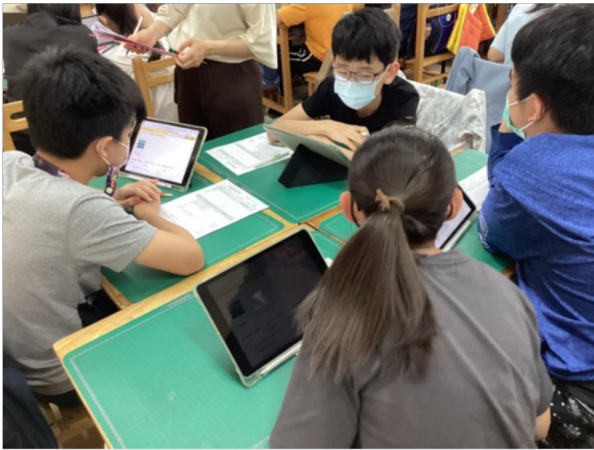
3-2學生在課堂中的參與程度