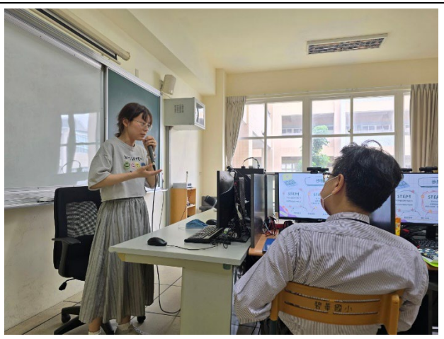
教師上台分享個人的教案設計。