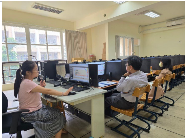
教師上台分享個人的教案設計。