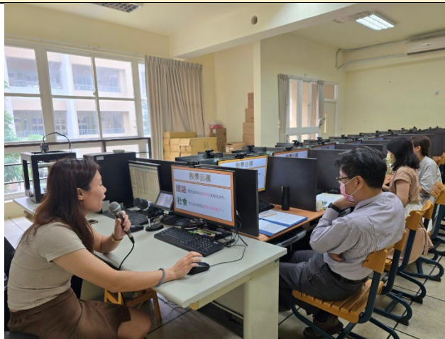
教師上台分享個人的教案設計。