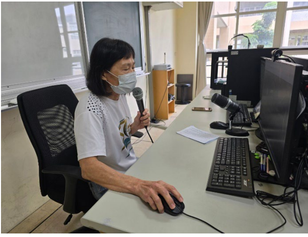
教師上台分享個人的教案設計。