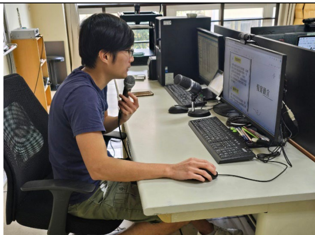
教師上台分享個人的教案設計。