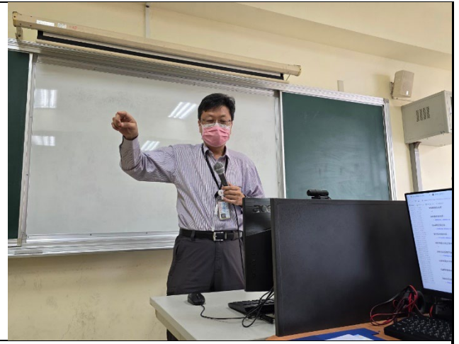
專家學者回饋、指導與建議。