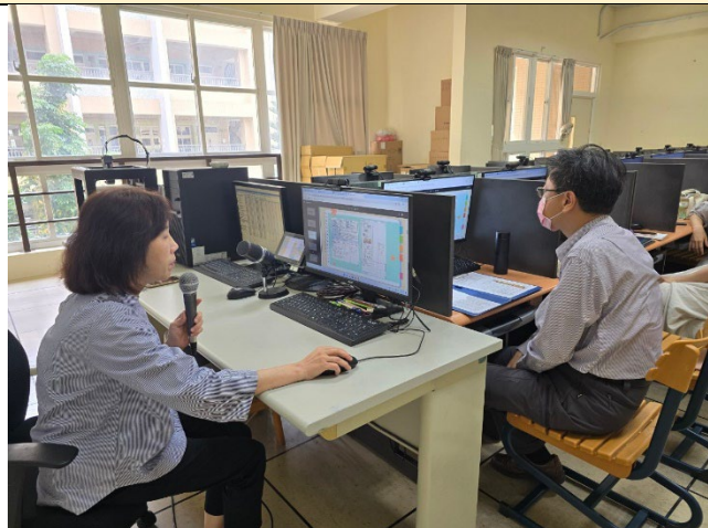
教師上台分享個人的教案設計。