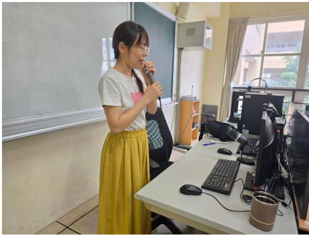
教師上台分享教學成果。