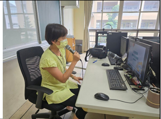
教師上台分享教學成果。