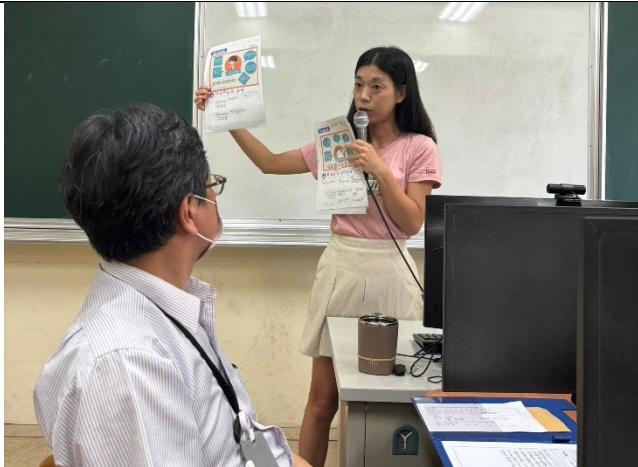
教師上台分享教學成果。