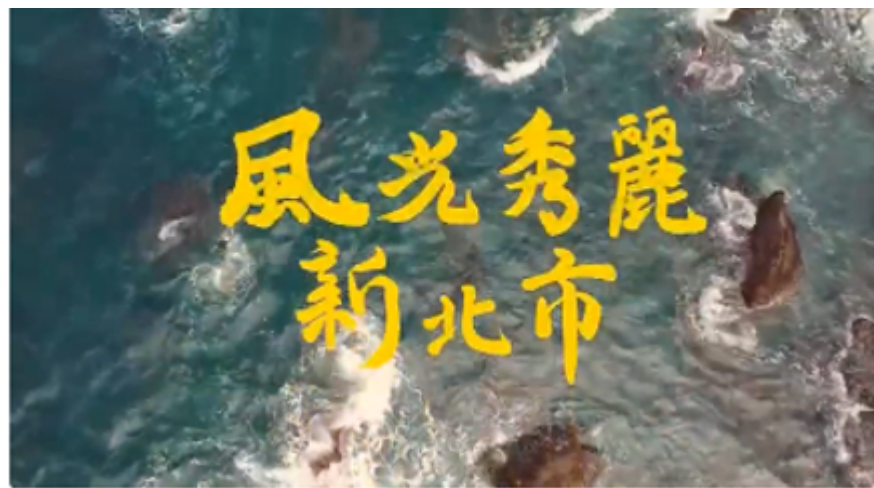
新北市舊地名影片和歌曲

https://www.youtube.com/watch?v=cwJruCXzt9Y