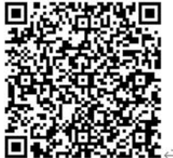
中小學使用生成式人工智慧注意事項