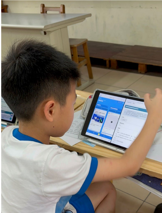
照片 2：學生利用平板進行 Padlet 自主學習與數位筆記

說明內容：學生於國語課時，利用 iPad 開啟 Padlet 班級協作平台。照片中可見學生正透過「分屏功能」，一邊參考老師上傳的數位教材說明，一邊進行資料檢索與內容瀏覽。